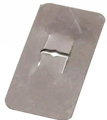
TH + VLR